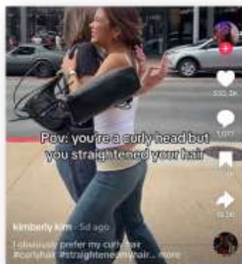
Gambar 6. Postingan Tiktok dengan Slang ‘POV’.

Terakhir, slang “POV” merupakan singkatan dari “Point of View” yang berarti sudut pandang. Dalam konteks TikTok, istilah ini digunakan untuk menandai jenis konten yang disajikan dari perspektif tertentu, seolah-olah penonton berada dalam situasi yang digambarkan. Fungsi dari slang ini adalah sebagai narasi konten, yang membantu pengguna memahami sudut pandang atau alur cerita dalam video. Penggunaan “POV” menunjukkan bagaimana bahasa dapat beradaptasi dengan format media baru, khususnya dalam menciptakan pengalaman yang lebih imersif bagi penonton.