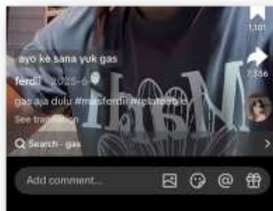
Gambar 5. Postingan Tiktok dengan Slang ‘Gas’

Slang “FYP” merupakan singkatan dari “For You Page”, yaitu halaman rekomendasi utama pada platform TikTok yang menampilkan video-video sesuai dengan preferensi pengguna. Dalam konteks penggunaannya, istilah ini sering digunakan dalam komentar atau caption untuk meningkatkan kemungkinan suatu konten muncul di halaman tersebut. Fungsi utama dari slang ini adalah sebagai penanda konteks platform, yang menunjukkan pemahaman pengguna terhadap sistem algoritma TikTok. Penggunaan singkatan seperti “FYP” mencerminkan efisiensi komunikasi di era digital, di mana pengguna cenderung memilih bentuk bahasa yang lebih ringkas dan praktis.