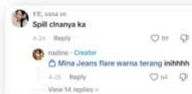
Gambar 1. Komentar TikTok dengan Slang ‘Spill’.

Untuk memperkuat temuan tersebut, berikut disajikan beberapa contoh penggunaan slang TikTok yang diambil dari komentar pengguna pada platform TikTok. Data ini menunjukkan bagaimana slang digunakan secara nyata dalam interaksi digital sehari-hari.