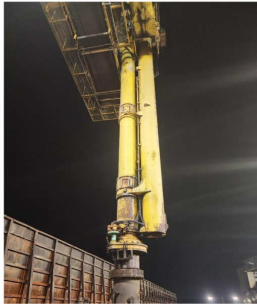
Gambar 5. Vertical Screw Siwertell