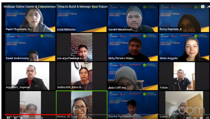
Gambar 2. Promosi di Instagram Story mahasiswa wपालangkaraya