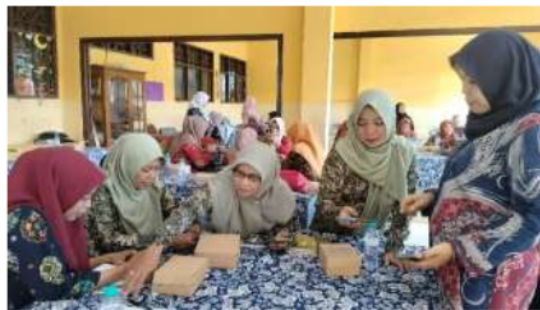
Gambar 3.4 Peserta Berdiskusi Kelompok

Saat pemaparan materi, banyak respons yang diberikan oleh peserta melalui jawaban atas pertanyaan pemantik yang dilontarkan. Ada juga pertanyaan-pertanyaan yang terkait dengan materi yang sedang didiskusikan.