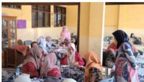
Gambar 3.3 Peserta Presentasi Rancangan Modul Ajar Pembelajaran Berdiferensiasi Berbasis Produk