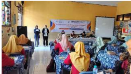
Gambar 3.1 Pembukaan Acara Pendampingan Workshop Pembelajaran Berdiferensiasi Berbasis Produk

Kegiatan pendampingan diselenggarakan untuk guru-guru di sekolah dasar gugus 2 kabupaten Gresik yang bertempat di SDN 163 Gresik. Acara di mulai tepat waktu sesuai rundown acara yang dibuat. Peserta antusias menghadiri kegiatan, meskipun dalam nuansa libur sekolah, terlihat melalui indikator jumlah dan waktu kehadiran. Pembukaan acara dihadiri oleh pengawas sekolah kabupaten Gresik, Ketua K3S, para Kepala Sekolah, dan Peserta.