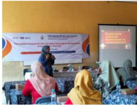
Gambar 3.2 Pemaparan materi Pembelajaran Berdiferensiasi Berbasis Produk

Saat pemaparan materi, banyak respons yang diberikan oleh peserta melalui jawaban atas pertanyaan pemantik yang dilontarkan. Ada juga pertanyaan-pertanyaan yang terkait dengan materi yang sedang didiskusikan.