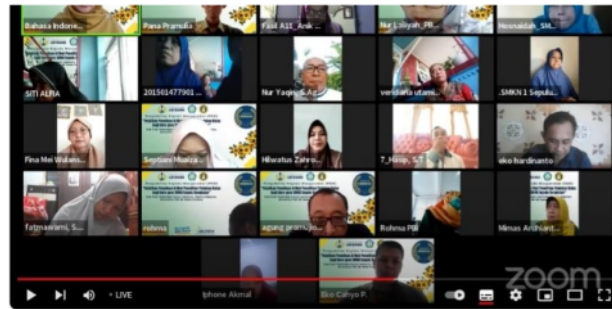
Gambar 3.1 Sosialisasi Materi PkM

Merujuk pada pandangan Suparno (1988) kata tugas “untuk” digunakan untuk mengantarkan tujuan dan kata tugas “bagi” digunakan untuk mengantarkan objek.