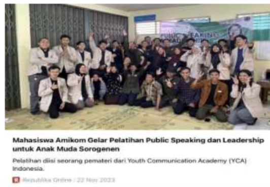
Gambar 5 Publikasi

https://rejogja.republika.co.id/berita/s4hv2291/mahasiswa-amikom-gelar-pelatihan-public-speaking-dan-leadership-untuk-anak-muda-sorogenen