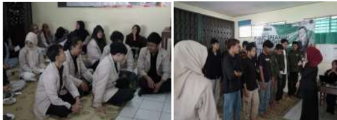
Gambar 2 Pelatihan Public speaking

Pelatihan public speaking kepada para peserta Karang Taruna Wirasoma yang dengan pemateri dari YCA (Youth Communication Academy). Kegiatan ini dilakukan melalui 2 metode yaitu pemberian materi melalui presentasi dan praktek langsung kepada peserta untuk mencoba melakukan public speaking . Kegiatan ini bertujuan untuk melatih generasi muda dari Karang Taruna Wirasoma agar percaya diri dan bisa untuk berbicara menyampaikan informasi ataupun gagasan di hadapan khalayak umum.