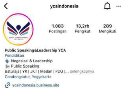
Gambar 1: Akun instagram YCA Indonesia

YCA berdiri pada tanggal 28 April 2018 dan sudah memiliki 13,2 ribu followers di instagram serta selalu aktif dalam memposting konten-konten mengenai ilmu public speaking . Memiliki jenis pelatihan dan program pelatihan cukup beragam dari mulai interpersonal skill & public speaking , AMT (Achievement Motivation Training), manajemen SDM/Tim/Organisasi dan Leadership serta program pelatihan in house training, public training, private training dan reguler training. Kota Yogyakarta memiliki psikologi behaviour anak-anak muda yang ingin menjadi public speaker, mahasiswa yang ingin mengekspresikan dirinya, dan profesional muda yang ingin mengembangkan potensi dirinya melalui kemampuan komunikasi. YCA sudah memiliki beberapa pencapaian perusahaan seperti Perusahaan jasa terbaik 1 (gold medal) versi Kemenristekdikti KMI 2019, Perusahaan jasa terbaik 3 (Bronze Medal) versi kemenristekdikti KMI 2018 dan Lolos dana hibah PIMNAS 31 Kemenristekdikti tahun 2018.