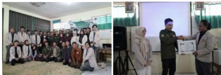
Gambar 3 Pelatihan Leadership

Pelatihan leadership kepada para peserta Karang Taruna Wirasoma yang dengan pemateri dari YCA (Youth Communication Academy). Kegiatan ini dilakukan melalui 2 metode yaitu pemberian materi melalui presentasi dan praktek langsung kepada peserta melalui permainan mengenai arti leadership atau jiwa kepemimpinan. Kegiatan ini memiliki tujuan agar peserta Karang Taruna Wirasoma memahami dan memiliki jiwa kepemimpinan yang mampu membawa perubahan serta mencapai tujuan bersama.