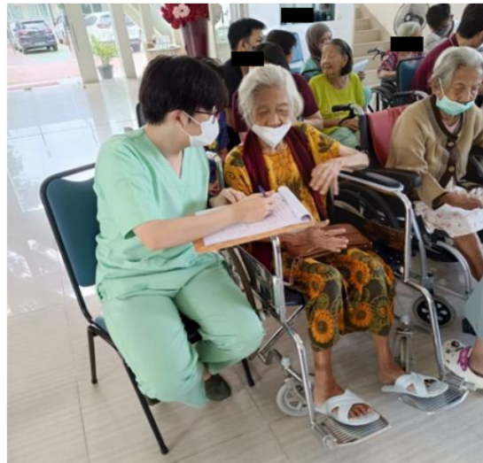
Gambar 1. Kegiatan Wawancara di Panti Werda Hana

Kegiatan edukasi dan deteksi dini insomnia ditujukan untuk populasi lanjut usia yang dilaksanakan di Panti Werda Hana, Tangerang Selatan. Kegiatan ini diikuti oleh 61 peserta. Seluruh lansia yang mengikuti kegiatan dilakukan wawancara mengenai kualitas tidur (Gambar 1). Hasil wawancara mengenai kualitas tidur dengan menggunakan kuesioner (Gamabr 2) dilampirkan.