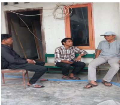
Gambar 2. Pendataan Anggota Muhammadiyah di PCM Kelayu