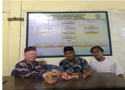
Gambar 3. Pemberian Ring Basket