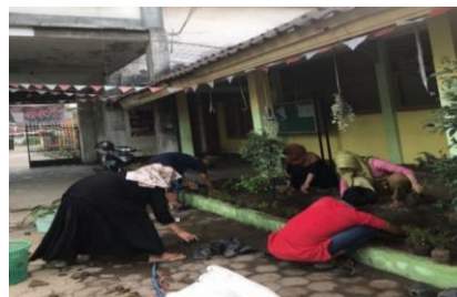
Gambar 6. Pembuatan Apotek Hidup