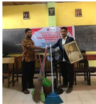
Gambar 4. Pemberian alat Kebersihan