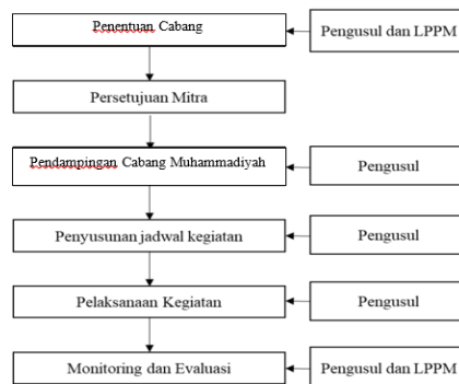
Gambar 1. Mekanisme pembinaan dan pengembangan PCM kelayu

Mekanisme pembinaan dan pengembangan Cabang Muhammadiyah di Kelayu dapat dilihat pada alur dibawah ini: