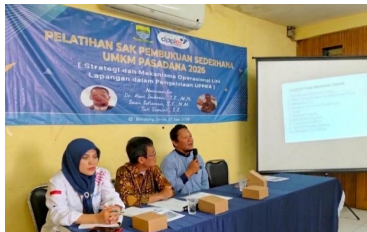
Gambar 2. Pelatihan SAK Pembukuan Sederhana menggunakan Accurate .

Peningkatan kapasitas pelaku UMKM melalui pendampingan dan pelatihan memiliki dampak signifikan terhadap kualitas laporan keuangan (Susanti et al., 2022). Selain itu, adopsi digitalisasi yang terjadi pada pelaku UMKM dalam kegiatan ini juga sejalan dengan temuan Pramono et al. (2023) yang menekankan pentingnya kesiapan pengguna dalam implementasi digital accounting.