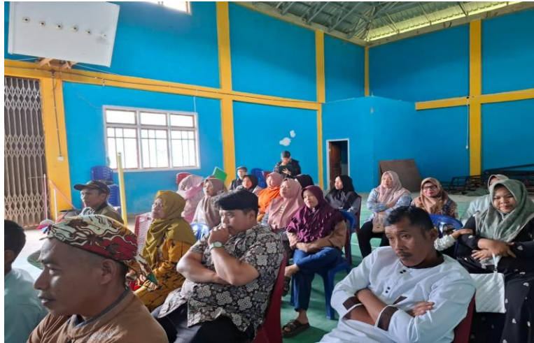
Gambar 3. Peserta Pelatihan SAK Pembukuan Sederhana.

Melalui kegiatan pengabdian yang dilakukan secara partisipatif, ditemukan bahwa intervensi berupa pelatihan dan pendampingan mampu menjadi solusi efektif dalam menjembatani kesenjangan tersebut. Peningkatan kapasitas pelaku UMKM tidak hanya terjadi pada aspek pengetahuan, tetapi juga pada perubahan praktik dan perilaku dalam pengelolaan keuangan. Hal ini menunjukkan bahwa pendekatan berbasis pemberdayaan ( capacity building ) memiliki peran penting dalam mendorong transformasi pengelolaan keuangan UMKM (UNDP, 2009).