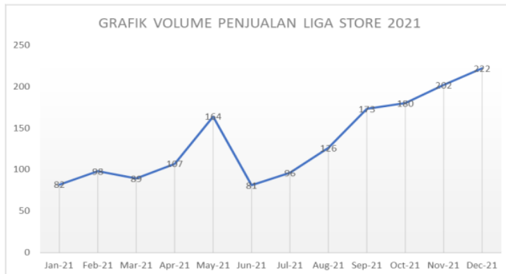
Gambar 1. 2 Grafik Volume Penjualan Liga Store Makassar Periode 2021