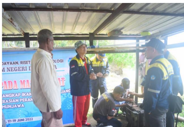
Gambar 3. Penjelasan Materi