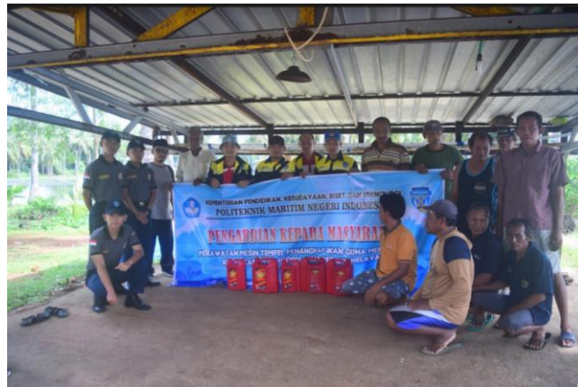
Gambar 1. Foto bersama dengan Nelayan

Untuk menyelesaikan masalah dan tujuan yang ingin dicapai maka dirumuskan metode kegiatan dengan tahapan sebagai berikut :