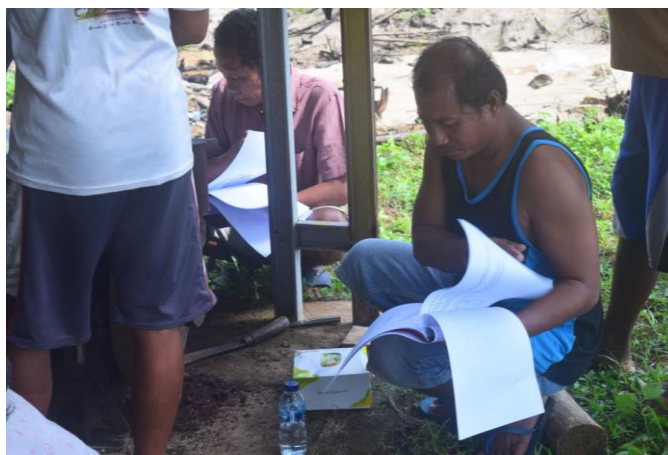
Gambar 2. Pemberian Materi

Peserta dengan antusias mengikuti penjelasan dari tim pengabdian yang memberi penjelasan tentang perawatan mesin perahu tempel nelayan dengan baik dan dapat diaplikasikan di lapangan.