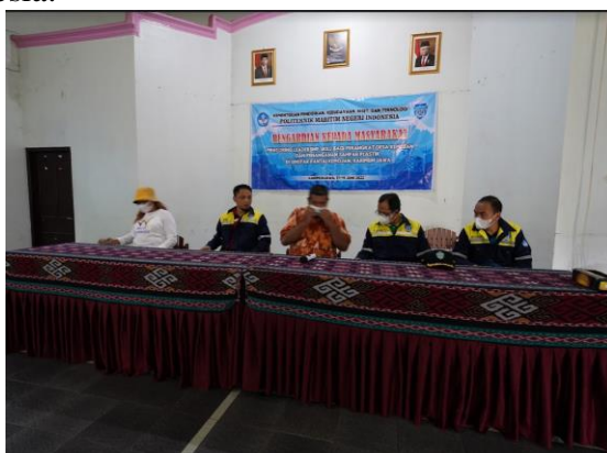
Gambar 1. Acara pembukaan oleh Bapak Lurah

Lokasi Pengabdian Pada Masyarakat kali ini di dusun Jelumun RT 05, RW 02, Kemujan, Karimunjawa, Kabupaten Jepara. Latar belakang dari pelaksanaan Pengabdian Pada Masyarakat di Karimunjawa berdasar pada fakta bahwa banyak masyarakat yang mata pencahariannya sebagai nelayan. Nelayan Indonesia cara menangkap ikan masih banyak menggunakan cara-cara yang merusak (Destructive fishing) antara lain dengan menggunakan pukot harimau(trawl), penggunaan bom (dynamite fishing dan menggunakan potas (cyanide Fishing) (Nurdin, 2010; Tanjung dan Nasution, 2003).dalam hal ini bertentangan dengan UU no.31 tahun 2004 pasal 8 ayat 1 yang isinya bahwa setiap orang dilarang menangkap ikan dengan menggunakan bahan kimia, bahan biologis, bahan peledak, alat atau cara dan atau bangunan yang merusak ,merugikan ,membahayakan kelestarian sumberdaya/atau lingkungan di wilayah pengelolaan perikanan Republik Indonesia.