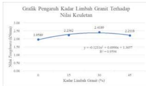
Gambar 2. Grafik Pengaruh Kadar Limbah Granit Terhadap Nilai Keuletan