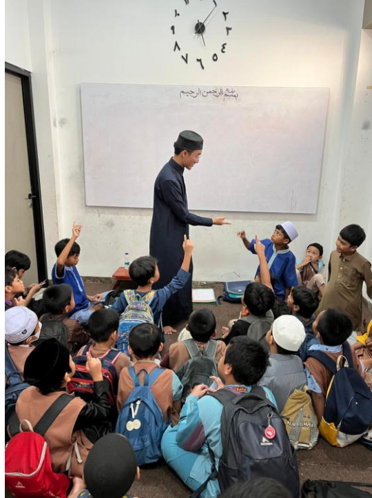
Gambar 2. Penerapan Metode Talaqqi di TPQ Markaz Imam Syafii Condet

Hasil observasi menunjukkan bahwa interaksi antara guru dan santri berlangsung secara intensif dan personal. Setiap santri mendapatkan kesempatan untuk membaca secara individual, sehingga kesalahan dalam pengucapan makhraj maupun penerapan tajwid dapat segera diperbaiki. Salah satu ustadz menyampaikan bahwa “metode talaqqi memungkinkan kami untuk langsung mengetahui kesalahan santri dan memperbaikinya saat itu juga, sehingga mereka tidak terbiasa dengan bacaan yang salah.”