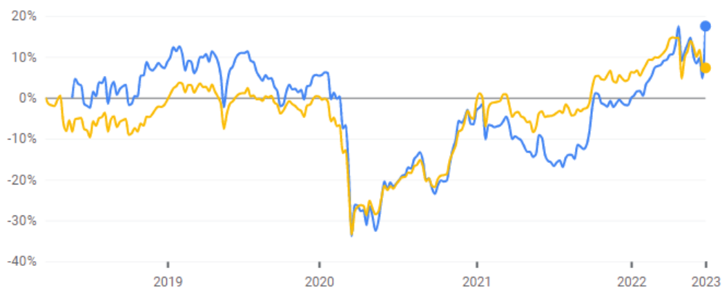
Gambar 2 Grafik Perbandingan Pergerakan Idx High Dividend 20 Dengan Ihsg

Terdapat 48 Indeks Saham Yang Sudah Di Keluarkan Oleh Bursa Efek Indonesia (Bei) Dan Salah satunya Yaitu Indeks Idx High Dividend 20 Yang Merupakan 20 Saham Perusahaan Dengan Nilai Dividen Tertinggi. Berikut Pergerakan Indeks Idx High Dividend 20 (Warna Biru) Jika Dibandingkan Dengan Indeks Harga Saham Gabungan (Ihsg) (Warna Kuning) Selama 5 Tahun Terakhir: