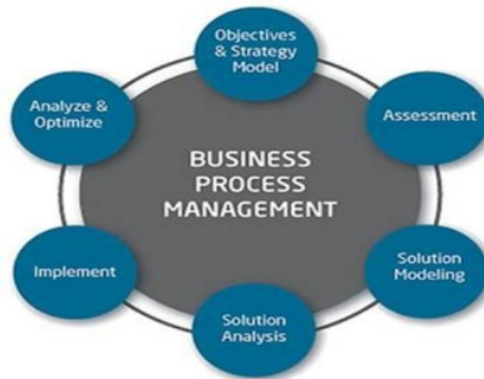
Gambar 2. Skema Perencanaan Proses Produksi