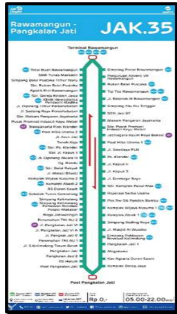
Gambar 2 Peta Rute JAK 35 Pangkalan Jati - Rawamangun

Rute ini menghubungkan Rawamangun dengan Pangkalan Jati dan sebaliknya. Rute ini melewati beberapa tempat strategis seperti Terminal Rawamangun, Tip Top Rawamangun, Pasar Klender, RS Harum, Perumahan TNI AU, Naga Jatiwaringin, RS Duren Sawit, Komplek Wijaya Kusuma, dan jalan kecil lainnya (Sahara, S. 2023)