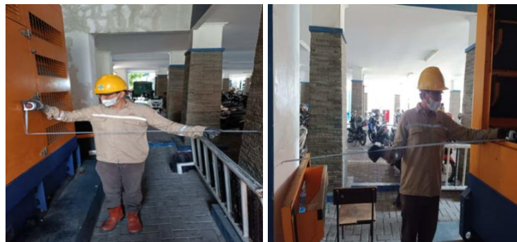
Gambar 2. Pengukuran Jarak Bebas