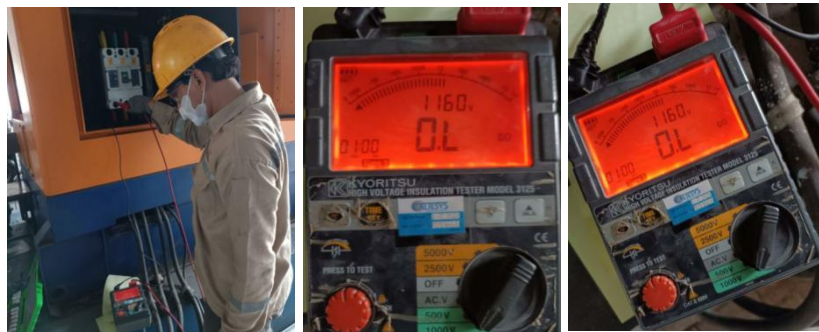
Gambar 3. Pengukuran Tahanan Isolasi

( absorption current ). Parameter dan kriteria kelulusan dielektrik untuk metode ini telah diperketat dalam pembaruan pedoman IEEE 43-2024 (IEEE Power and Energy Society, 2024). Selama proses injeksi berlangsung, pembacaan nilai resistansi isolasi ekuivalen (dalam satuan Mega-Ohm) direkam secara presisi pada menit pertama sebagai representasi nilai Tahanan Isolasi (IR) dasar, dan terus dilanjutkan hingga menit kesepuluh. Rasio perbandingan antara nilai resistansi pada menit kesepuluh terhadap menit pertama kemudian dihitung untuk menghasilkan Indeks Polarisasi (PI). Kalkulasi PI ini berfungsi sebagai indikator krusial dalam mendeteksi akumulasi kontaminan, penetrasi uap air, serta mengevaluasi tingkat degradasi polimer isolasi. Keunggulan utama dari parameter PI ini adalah akurasinya yang konsisten dan tidak terpengaruh oleh fluktuasi suhu ruang selama masa pengujian (Mahendra et al., 2023).