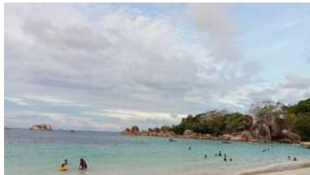
Gambar 2. Pantai Tanjung Tinggi

Pantai ini adalah tempat di mana syuting Film Laskar Pelangi dan Sang Pemimpi yang dikenal dengan pantai Laskar Pelangi . Dari pusat kota Belitung, yaitu Tanjungpandan, jarak ke pantai Tanjung Tinggi tidak begitu jauh. Cukup menempuh jarak 31 kilometer. Banyaknya bebatuan yang besar membuat rasa penasaran wisatawan yang menjadikan tempat ini semakin menarik karena bebatuan yang besarnya Belitung ditetapkan oleh UNESCO sebagai Global Geopark. Tidak hanya itu pantai Tanjung Tinggi memiliki fasilitas yang cukup memadai. Seperti penginapan, restoran, transportasi, dan pantai ini juga menyediakan lapangan golf tidak jauh dari area pantai. Keindahan sunset Pantai Tanjung Tinggi pada sore hari siapapun yang melihatnya akan terpesona dengan keindahannya. Spot foto yang bagus dengan latar belakang laut yang jernih dan matahari terbenam (Destyananatalia, 2023).