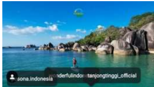
Gambar 7. Tag Photo @tanjongtinggi_official

Tag photo sangat efektif untuk menandai akun Instagram di gambar tempat pengambilannya. Tag akan muncul sebagai label di foto dan pengikut di akun yang memposting bisa mengetuk tag tersebut untuk melihat profil akun Instagram yang di tag .