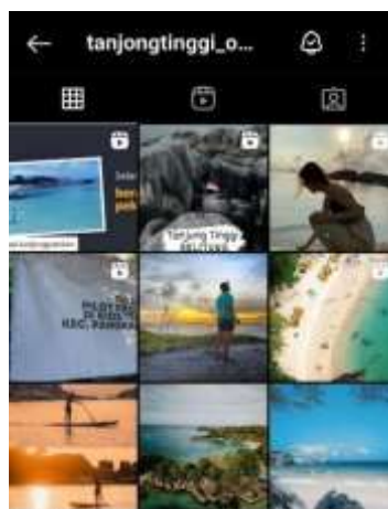
Gambar 5. Postingan Foto @tanjongtinggi_official

Selain penggunaan hashtag , Akun Instagram @tanjongtinggi_official memposting gambar berupa keindahan dari pantainya. Kemampuan untuk mengelola foto dan video sangat berperan besar guna menciptakan feeds atau tampilan yang menarik (Sakinah, 2018). Fitur foto ataupun video di Instagram, akan lebih mudah untuk mempromosikan Pantai Tanjung Tinggi kepada wisatawan yang belum mengenal pantai tersebut melalui postingan yang diunggah ke akun Instagram.