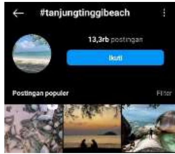
Gambar 4. Hashtag #tanjongtinggibeach