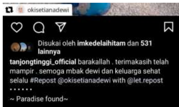
Gambar 6. Repost @tanjongtinggi_official

Fitur unggahan ulang dari postingan pengguna lain yang pastinya bersangkutan dengan akun Pantai Tanjung Tinggi. Instagram @tanjongtinggi_official dari postingannya banyak mengunggah repost yang disertai tanda pada akun pengguna asli. Ini bisa juga menjadi ciri khas akun @tanjongtinggi_official yang membuat para wisatawan menjadi tertarik lagi untuk berkunjung karena momennya bisa diabadikan. Repost dilakukan untuk memikat para pengguna Instagram yang belum mengetahui agar bisa tertarik berkunjung ke Pantai Tanjung Tinggi.