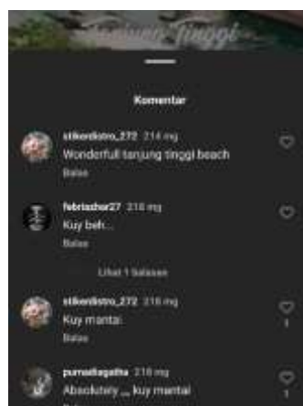
Gambar 8. Comment @tanjongtinggi_official

Kegunaan comment pada social media memberikan kesan positif terhadap daya tarik pariwisata (Nugraha & Dami, 2021). Tersedia kolom komentar di setiap postingan untuk menampung respon para pengguna saat melihat apa yang diposting.