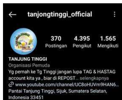
Gambar 3. Akun Pantai Tanjung Tinggi

Melakukan pemanfaatan Instagram sebagai media promosi adalah salah satu rencana yang dilakukan dalam meningkatkan minat wisatawan untuk terpikat melakukan kunjungan destinasi wisata Pantai Tanjung Tinggi. Pada penelitian ini, di gunakan untuk melihat manfaat dari platform Instagram terkait konten yang di unggah mengenai pariwisata di Pantai Tanjung Tinggi. Instagram menciptakan fitur following, yang diartikan bahwa akun yang ada di Instagram bisa berinteraksi dan saling mengikuti walaupun berada di luar negeri sekalipun, karena Instagram di ciptakan dengan jangkauan jaringan yang tersebar luas di dunia. Instagram dimanfaatkan untuk mempermudah media promosi, karena 3 karakteristik utama yang dimiliki yaitu foto, display atau tampilan yang simple atau sederhana dan adanya hashtag yang mempermudah pencarian di Instagram (Verawati, 2016 dikutip dalam (Ardiansah & Maharani, 2020).