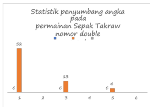
Gambar 4. 1 Statistik Penyumbang angka pada permainan Sepak Takraw nomor Double event

Pada sub bab ini telah dijelaskan bahwasanya penelitian ini menggunakan pendekatan penelitian kuantitatif. Mengenai hasil penelitian yang telah dilakukan, dimulai dari persentase penelitian yang berhubungan dengan data penelitian (Meliputi jumlah smash, jumlah service dan jumlah block) hasil pengujian hipotesis yang diuji secara tabel dengan menggunakan pengolahan data.