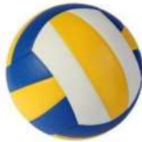
Gambar Bola Voli