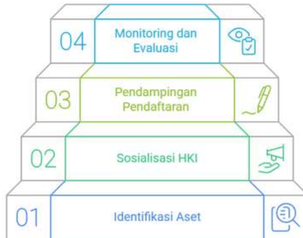
Gambar 1. Tahapan Sosialisasi dan Pendampingan Hak Kekayaan Intelektual bagi UMKM.

Tahap terakhir ini mengajarkan UMKM cara memonitor potensi pelanggaran Hak Kekayaan Intelektual (HKI), baik melalui pencarian berkala di online market atau e-commerce (Shopee atau Tokopedia) maupun laporan masyarakat beserta melakukan evaluasi hasil sosialisai serta pelatihan dari para peserta.