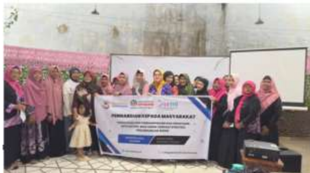
Gambar 5. Peserta Pelatihan dan Dosen Universitas Sains dan Teknologi Komputer.