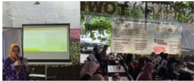
Gambar 4. Sosialisasi dan Pendampingan Hak Kekayaan Intelektual (HKI) bagi UMKM.

Metode sosialisasi serta pendampingan berbasis praktik langsung dengan mengenalkan tentang perlindungan HKI pada produk UMKM melalui berbagai materi dan mengenalkan pendaftaran HKI melalui website https://www.dgip.go.id/ melalui berbagai fitur untuk mendaftarkan e-Hak Cipta melalui platform digital.