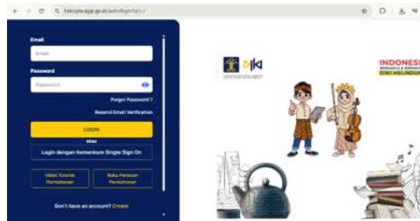
Gambar 3. Website Direktorat Jenderal Kekayaan Intelektual (DJKI) KEMENKUMHAM.

Metode sosialisasi serta pendampingan berbasis praktik langsung dengan mengenalkan tentang perlindungan HKI pada produk UMKM melalui berbagai materi dan mengenalkan pendaftaran HKI melalui website https://www.dgip.go.id/ melalui berbagai fitur untuk mendaftarkan e-Hak Cipta melalui platform digital.