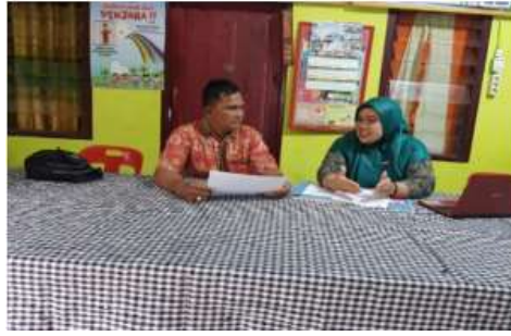
Gambar 3. Diskusi Penyuluhan Optimalisasi Pengaturan Keuangan Desa.

Permendagri Nomor 20 Tahun 2018 menjelaskan bahwasannya pengaturan keuangan desa mencakup seluruh hak serta kewajiban yang bernilai uang, termasuk aset desa berupa uang maupun barang yang terkait penerapan kewajiban tersebut. Proses ini berlangsung secara menyeluruh, meliputi tahapan mulai dari perencanaan, penerapan, pencatatan, maklumat, hingga tugas, sehingga setiap langkah pengaturan keuangan desa dapat terlaksana melalui tertib serta terkontrol.