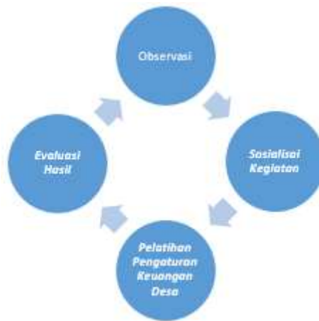
Gambar 2. Rencana Penerapan Aktivitas Pengabdian Kepada Masyarakat.

Desa Pematang Serai, Kabupaten Langkat adalah