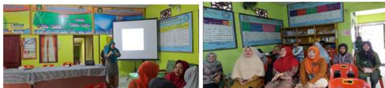
Gambar 4. Pembinaan Pengaturan Keuangan Desa pada Menaikkan Kinerja Keuangan Desa Di Pemerintah Pematang Serai.

Pembinaan pengelolaan keuangan desa dilakukan kepada aparaturnya pemerintah desa melalui arahan sehingga perangkat desa dapat melakukan monitoring serta evaluasi pada menjalankan pengelolaan keuangan desa, Berikut aktivitas pembinaan pengaturan keuangan desa pada menaikkan kinerja keuangan.