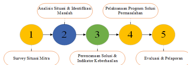
Gambar 1. Alir pelaksanaan PKM.

Metode pelaksanaan pada kegiatan PKM merupakan serangkaian cara sistematis yang digunakan untuk membantu menyelesaikan permasalahan mitra. Metode yang digunakan adalah penyelesaian berbasis masalah. Alir kegiatan pelaksanaan PKM yang akan dilaksanakan secara berurutan mengikuti diagram pada Gambar 1 di bawah ini.