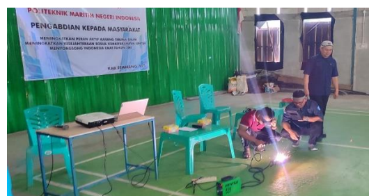
Gambar 5. Pemaparan Materi Dasar-Dasar Las Busur Listrik.

Pada sesi terakhir kegiatan PKM disampaikan materi tentang teknologi las busur listrik. Materi pengelasan disampaikan sebagai bagian dari ketrampilan yang mampu mendukung kompetensi anggota Karang Taruna agar tumbuh ide kreatif dan produktif. Pada sesi penyampaian materi dijelaskan bahwa Las listrik adalah proses penyambungan logam dengan mencairkan permukaan logam induk dan elektroda. Proses pencairan logam menggunakan panas busur listrik (suhu \pm 3.000\text{ }^{\circ}\text{C} ) sehingga terbentuk sambungan yang kuat. Busur listrik muncul saat elektroda disentuhkan lalu ditarik sedikit dari logam. Panas tinggi ini melelehkan logam induk dan elektroda hingga menyatu. Pelaksana PKM memberikan pendampingan dan pembinaan terkait jarak busur, sudut elektroda, dan kecepatan gerakan tangan agar hasil las lebih rata dan tidak menimbulkan percikan berlebih. Rangkain pelatihan las busur teori dan praktek disajikan pada Gambar 5.