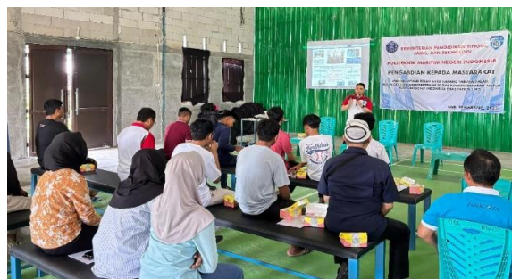
Gambar 3. Pemaparan Materi Tata Kelola Organisasi.

Pelaksanaan Kegiatan PKM dalam rangka meningkatkan peran aktif karang taruna dalam meningkatkan kesejahteraan sosial dapat terjadi jika banyak anggota terlibat dan aktif. Menumbuhkan rasa tanggung jawab sosial dan rasa kesadaran bermasyarakat, serta nasionalisme bagi anggota karang taruna memerlukan dorongan sehingga ada perubahan perilaku yang lebih baik (Maulana & Anshori, 2024). Kegiatan yang dilakukan untuk mencapai tujuan tersebut dilaksanakan secara bertahap dengan berbagai materi yang relevan oleh tim pelaksana yang melakukan PKM. Pada Gambar 3 dilakukan pemaparan materi tentang tata kelola organisasi karang taruna.