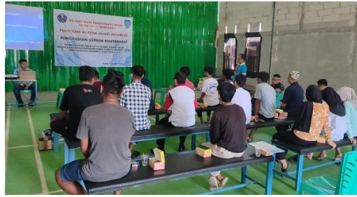
Gambar 4. Pemaparan Materi Budi Pekerti dan Pranoto Coro Jowo.

Budi pekerti merupakan salah satu aspek penting dalam kehidupan manusia. berhubungan secara sosial dengan akhlak, perilaku, dan moral dijadikan pedoman dalam bersikap sehari-hari. Dalam tradisi Jawa, budi pekerti bukan hanya sekadar aturan tentang benar atau salah. Lebih dalam lagi mencerminkan keselarasan antara pikiran, perasaan, dan tindakan yang selaras dengan norma masyarakat dan ajaran leluhur. Budi pekerti dianggap sebagai cermin dari pribadi yang utama. Nilai kejujuran, kesopanan, gotong royong, tepa selira, hormat kepada orang tua, serta rasa tanggung jawab kepada sesama. Budi pekerti sering dipandang sebagai pondasi utama pembentukan karakter seseorang. Seorang yang berilmu tanpa dibarengi budi pekerti dianggap “ngèlmu tanpa laku,” (Lestari et al., 2022). Peribahasa tersebut menggambarkan bahwa tidak akan memberi manfaat bagi diri maupun lingkungannya.