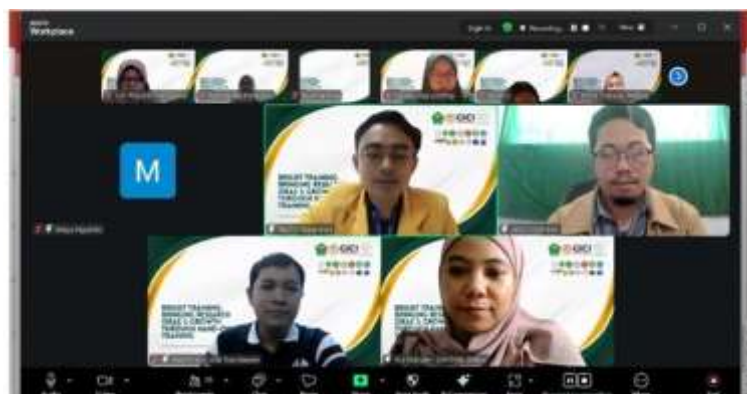
Gambar 3. Sosialisasi Program.

Gambar 2 menunjukkan adanya diskusi 13 Universitas yang ada di Indonesia mengenai Identifikasi Kebutuhan dan Perencanaan Program secara online, hasil diskusi ini akan menghasilkan program PKM ini. kemudian kegiatan dilanjutkan sosialisasi kegiatan ke komunitas komunitas PPI Johor Bahru yang di tunjukan Gambar 3.