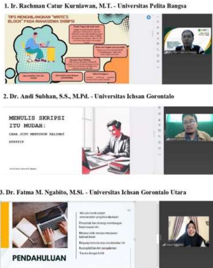
Gambar 4. Pelatihan dan Praktik Langsung.

Gambar 3 menunjukkan adanya sosialisasi dan diskusi program ke komunitas PPI Johor Bahru, sosialisasi ini bertujuan untuk mengutarakan dan menyampaikan kegiatan yang akan dilakukan serta mengatur waktu pelaksanaan kegiatan PKM ini. selanjutnya dilakukan pelatihan dan praktik langsung yang ditunjukkan Gambar 4