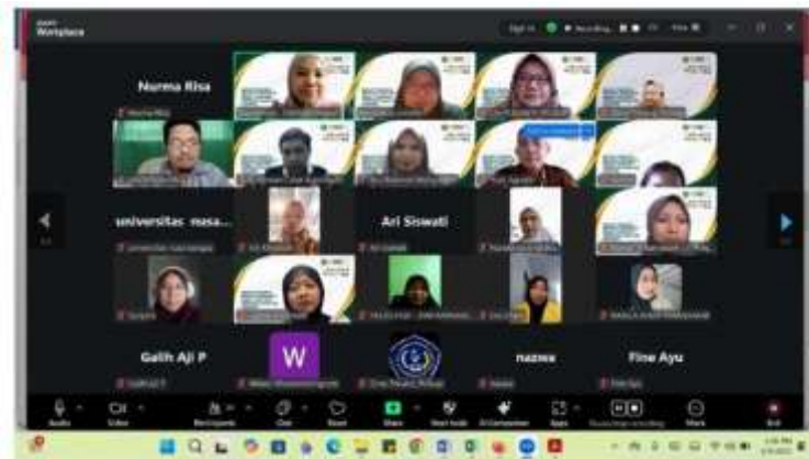
Gambar 2. Identifikasi Kebutuhan dan Perencanaan Program.

Dengan demikian, hasil pengabdian ini memberikan kontribusi tidak hanya pada peningkatan kompetensi mahasiswa, tetapi juga pada penguatan model pelatihan berbasis praktik dan pendampingan sebagai strategi efektif dalam kegiatan pengabdian masyarakat. Pendekatan ini dapat dijadikan sebagai model yang dapat direplikasi pada komunitas lain dengan karakteristik yang serupa. Kegiatan Pengabdian Masyarakat ini sudah dilakukan sesuai tahap yang direncanakan dari Identifikasi Kebutuhan dan Perencanaan Program di tunjukan Gambar 2