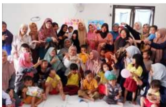
Gambar 4. Foto Kegiatan.