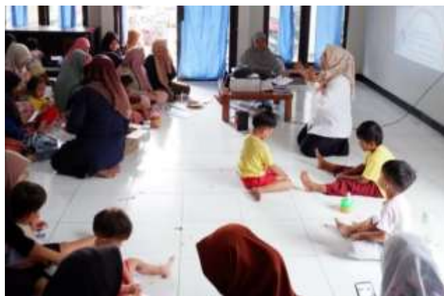
Gambar 2. Peserta Kegiatan menyimak materi.

Kegiatan pengabdian kepada Masyarakat dengan topik “Edukasi Literasi Baca Bagi Pendidikan Anak Usia Dini” diikuti oleh wali murid yang terdiri kurang lebih 30 orang, dengan menekankan pada program pembinaan literasi kepada seluruh pengajar PAUD dan orangtua siswa binaan. Hasil dari kegiatan ini adalah edukasi tentang pentingnya literasi bagi perkembangan anak usia dini, dengan rentang usia tiga sampai lima tahun. Para peserta terlihat antusias saat diberikan materi oleh tim pengabdian kepada masyarakat.