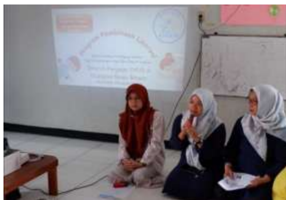
Gambar 3. Pemaparan Materi.

Pemberian materi tentang “Edukasi pentingnya literasi bagi perkembangan anak usia dini” diawali dengan pemaparan materi tentang konsep-konsep literasi, jenis-jenis literasi, manfaat literasi, dan gambaran umum terkait kondisi literasi masyarakat Indonesia. Selanjutnya, masuk ke materi inti yaitu mengajarkan literasi pada anak, mulai dari proses perkembangan otak anak, periode golden age, kemampuan motorik anak, serta mengenal tahapan kemampuan menulis anak. Kemudian materi ini diperkuat dengan penjelasan cara mengajarkan literasi pada anak, seperti mengajarkan literasi di rumah, serta mengembangkan kemampuan literasi di sekolah. Setelah pemberian materi, kegiatan pengabdian kepada masyarakat dilanjutkan dengan sesi diskusi dengan para peserta terkait materi yang diberikan.