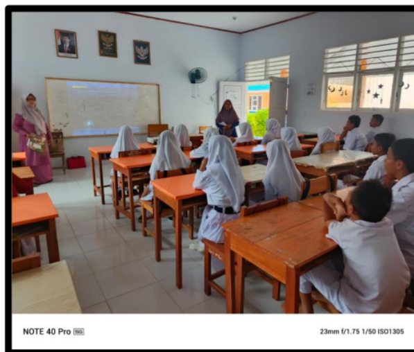
Gambar 1. Pemberian Ice Breaking

Kegiatan pengabdian ini diawali dengan pemberian Ice Breaking terlebih dahulu untuk mengunggah semangat dan motivasi belajar siswa serta membuat siswa menjadi lebih rileks dalam menerima dan menerapkan materi public speaking yang akan didapatkan. Pengabdian menggunakan media Wordwall untuk melakukan Ice Breaking . Hasil yang diperoleh yaitu siswa tampak antusias dalam memulai untuk menerima materi, karena Ice Breaking yang diberikan juga berkaitan dengan keterampilan berbicara yang menuntut siswa untuk tampil berbicara di depan teman lainnya.