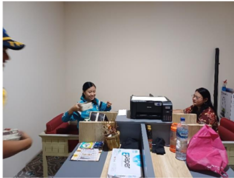
Gambar 4. Dokumentasi Kegiatan Sosialisasi kepada Staff PO Bus Gunung Harta

transportasi. Materi sosialisasi untuk staf mencakup bagaimana mereka dapat berkontribusi dalam memastikan bahwa armada bus selalu dalam kondisi layak jalan, mulai dari pemeriksaan rutin kendaraan hingga pengelolaan jadwal pengemudi agar terhindar dari kelelahan. Selain itu, mereka juga dilatih untuk memberikan informasi yang akurat dan edukatif kepada penumpang terkait prosedur keselamatan selama perjalanan. Staf juga diajak untuk lebih aktif dalam komunikasi dengan pengemudi, memastikan bahwa setiap perjalanan diawali dengan langkah-langkah keselamatan yang tepat. Dengan melibatkan staf secara penuh dalam sosialisasi ini, diharapkan tercipta lingkungan kerja yang lebih mendukung budaya keselamatan berkendara di PO Bus Gunung Harta, yang pada gilirannya akan meningkatkan kualitas pelayanan transportasi kepada penumpang. Adapun dokumentasi kegiatan pada Gambar 4.