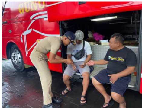
Gambar 3. Dokumentasi Kegiatan Sosialisasi kepada Pegemudi PO Bus Gunung Harta

Dalam pelaksanaan kegiatan sosialisasi Faktor Pemilihan Moda dan Berkendara Berkeselamatan di PO Gunung Harta, pengemudi menjadi fokus utama untuk meningkatkan standar keselamatan berkendara. Sosialisasi kepada pengemudi mencakup materi penting tentang tanggung jawab mereka dalam menjaga keselamatan penumpang dan diri sendiri selama perjalanan. Pengemudi diberikan pelatihan mengenai teknik berkendara defensif, pentingnya pemeriksaan kendaraan sebelum perjalanan, serta kepatuhan terhadap aturan lalu lintas dan batas kecepatan. Selain itu, penekanan juga diberikan pada pengelolaan kelelahan dan cara menghindari potensi gangguan yang dapat membahayakan keselamatan, seperti penggunaan ponsel saat mengemudi. Para pengemudi diajak untuk lebih peka terhadap faktor risiko di jalan dan mengambil langkah proaktif dalam menjaga keselamatan. Kegiatan ini didukung oleh simulasi langsung serta diskusi interaktif yang melibatkan para ahli keselamatan jalan. Hasilnya, para pengemudi menunjukkan peningkatan kesadaran akan pentingnya keselamatan dalam setiap aspek perjalanan, yang diharapkan dapat menurunkan angka kecelakaan dan meningkatkan kualitas pelayanan transportasi di PO Gunung Harta. Adapun dokumentasi kegiatan pada Gambar 3.