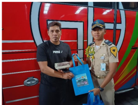
Gambar 2. Dokumentasi Kegiatan Sosialisasi kepada Penumpang PO Bus Gunung

Pada pelaksanaan kegiatan sosialisasi Faktor Pemilihan Moda dan Berkendara Berkeselamatan di PO Gunung Harta, penumpang menjadi salah satu sasaran utama dalam upaya meningkatkan kesadaran akan keselamatan transportasi. Sosialisasi kepada penumpang difokuskan pada pentingnya memilih moda transportasi yang aman dan terpercaya, serta peran mereka dalam mendukung keselamatan selama perjalanan. Penumpang diberikan pemahaman mengenai faktor-faktor yang perlu diperhatikan dalam memilih bus, seperti kondisi fisik kendaraan, kualifikasi pengemudi, serta kepatuhan terhadap standar keselamatan. Selain itu, mereka juga diajak untuk lebih aktif dalam menjaga keselamatan dengan mematuhi peraturan selama di perjalanan, seperti selalu menggunakan sabuk pengaman, tidak mengalihkan perhatian pengemudi, dan mengetahui prosedur evakuasi darurat. Sosialisasi ini disampaikan secara interaktif melalui presentasi, pembagian brosur edukatif, serta sesi tanya jawab yang memungkinkan penumpang untuk menyampaikan pertanyaan dan berbagi pengalaman. Hasilnya, penumpang menunjukkan peningkatan kesadaran akan keselamatan dan lebih berhati-hati dalam memilih serta menggunakan moda transportasi yang aman. Adapun dokumentasi kegiatan pada Gambar 2.