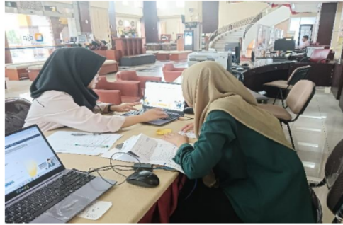
Gambar 1. Pendampingan Pengisian SPT Tahunan WPOP di KPP Madya Sidoarjo

memudahkan relawan pajak dalam pengisian SPT.