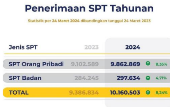
Gambar 4. Peningkatan Penerimaan SPT Tahunan

Namun, kegiatan ini juga menghadapi beberapa tantangan di lapangan. Salah satu kendala utama yang sering ditemui adalah masalah jaringan internet, terutama bagi peserta yang mengikuti pendampingan secara daring. Selain itu, masih banyak wajib pajak yang tidak membawa bukti potong pajak saat sesi pendampingan, sehingga menghambat proses pengisian SPT. Kendala lain yang cukup signifikan adalah kurangnya pemahaman wajib pajak tentang penggunaan e-Filing, terutama bagi generasi yang lebih tua atau mereka yang tidak terbiasa dengan teknologi. Kendala-kendala ini menjadi bahan evaluasi penting untuk meningkatkan kualitas dan efektivitas program pendampingan di masa mendatang.