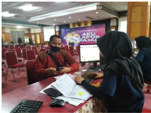
Gambar 2. Pendampingan Pengisian SPT Tahunan WPOP di KPP Pratama Sidoarjo Barat