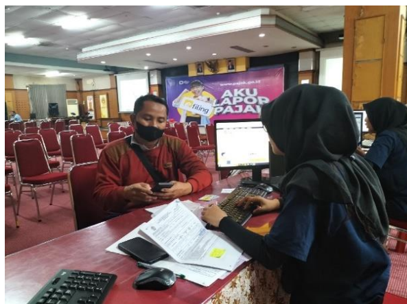
Gambar 2. Pendampingan Pengisian SPT Tahunan WPOP di KPP Pratama Sidoarjo Barat