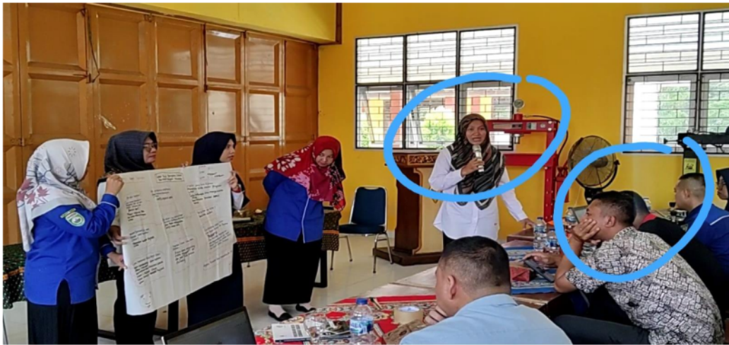
Gambar 3. Guru model menyampaikan strategi Adiksamba kepada peserta. Terlihat jelas antusias peserta dan rasa ingin tahu peserta dalam memahami literasi sains.