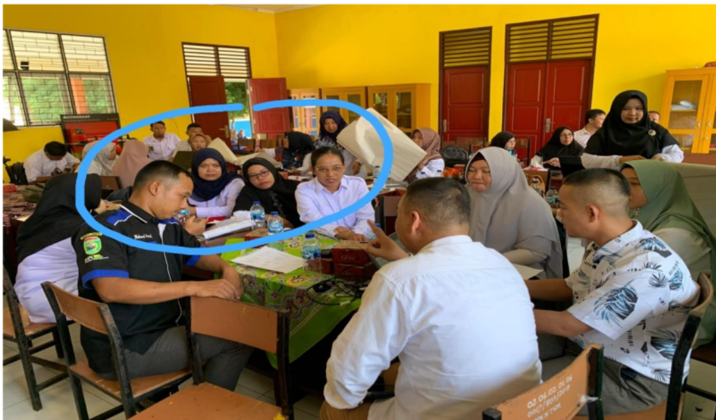
Gambar 2. Keterangan: Saling ketergantungan positif , Setiap guru dalam kelompok saling berbagi tugas dalam rancangan pembelajaran. Kegiatan refleksi untuk memberikan masukan dan mencari strategi yang tepat dalam penguatan literasi sains untuk memahami strategi literasi sains dalam kegiatan open class.

meningkatkan kualitas perencanaan pembelajaran (Fauziah & Putri, 2022), dan praktek mengajar (Rihhadatul Dzakia, Fitriyah Sulaeman, & Lambang, 2023). Guru yang berkualitas di abad 21 memiliki kemampuan dalam merancang pembelajaran menggunakan teknologi, melakukan diferensiasi melalui pemetaan kebutuhan belajar siswanya dengan analisa diagnosis dalam menyusun modul ajar berdasarkan tingkat kesiapan belajar siswanya (Yolanda, 2022). Selanjutnya kompetensi guru menggunakan refleksi untuk memperbaiki proses pembelajaran (Risnanosanti et al., 2022). Dalam penerapannya di kelas, guru abad 21 dituntut untuk selalu melakukan evaluasi perbaikan dan menggunakan strategi yang tepat agar tujuan pembelajaran tercapai untuk ragam siswanya yang berbeda-beda (Yolanda, Nisai, Pujiyanto, Aslia, & Sukmaniar, 2023). Sehingga dengan banyaknya belajar dapat membudayakan umpan balik dari teman sejawat (Komarudin, Qohar, & Ayubi, 2023), dan berbagi praktik baik tentang pembelajaran yang menyenangkan yang meningkatkan literasi sains (Lestari, 2021).