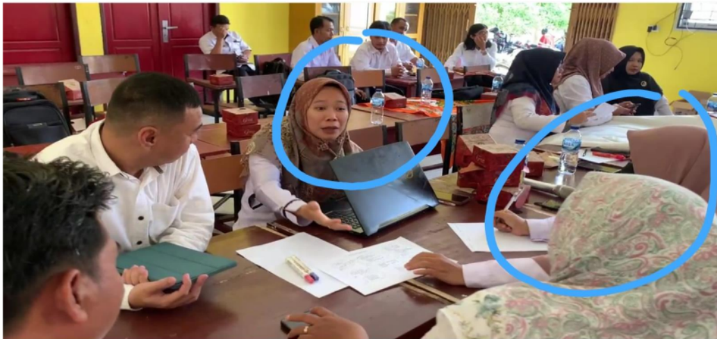
Gambar 4. Lesson study memberikan dampak positif kepada peserta dalam problem solving. Terlihat saat diskusi kelompok peserta saling memberikan pendapat untuk menyusun scenario pembelajaran literasi sains. Lesson study terbukti dapat mengembangkan percaya diri peserta, pengambilan keputusan dan keterampilan dalam mengelola konflik.