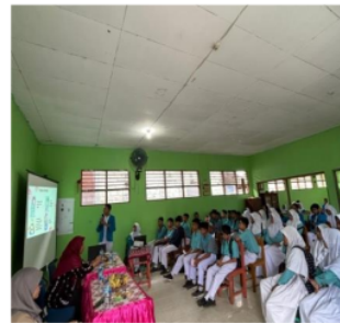
Gambar 2. Edukasi Kesehatan tentang Pentingnya Pencegahan anemia Pada Remaja di MTs Al-Muhajirin Ambon