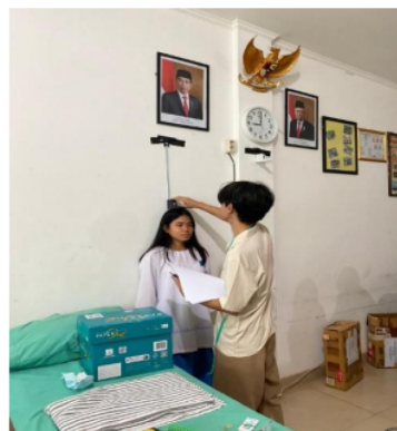
Gambar 1. Rangkaian Kegiatan Pelaksanaan

Kegiatan ini mengikutsertakan 167 peserta yang terdiri dari 58 laki-laki dan 109 perempuan. Gambar 1 menunjukkan rangkaian kegiatan pelaksanaan di SMAN 75, Jakarta Utara, Gambar 2 menunjukkan hasil pengukuran IMT berdasarkan jenis kelamin, dan Gambar 3 menunjukkan hasil pengukuran lingkar pinggang berdasarkan jenis kelamin.