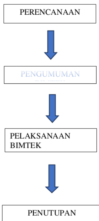
Gambar 1: Tahapan Pelaksanaan Kegiatan

Berupa distribusi materi pelatihan yaitu dengan memberikan materi pelatihan dalam bentuk cetak dan digital kepada peserta sebagai referensi dalam menjalankan tugas pengawasan di kelurahan/desa.