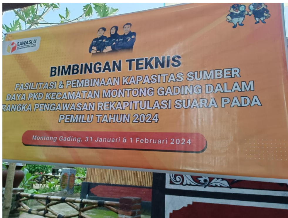
Gambar 1: Persiapan pelaksanaan Bimbingan Teknis

Peningkatan etika dan integritas yang dimaksud disini adalah pengawas memahami pentingnya menjaga integritas dan netralitas dalam melaksanakan tugas. Serta adanya komitmen yang kuat untuk menjalankan tugas dengan transparan dan tanpa memihak.