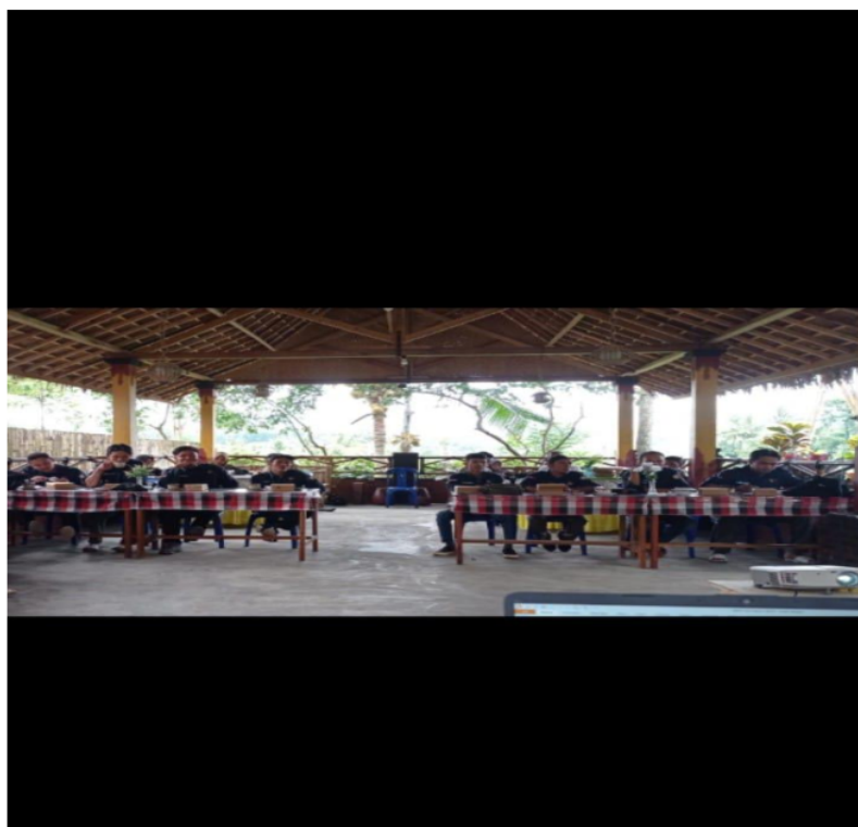
Gambar 4: Peserta pelaksanaan bimtek PKD

Terkait dengan pemahaman dan keterampilan menunjukkan bahwa Sebagian besar peserta memahami yang disampaikan oleh pemateri terkait dengan Pengawasan PKD ini. Dan pada umumnya peserta memberikan umpan balik positif mengenai materi dan metode pelatihan. Mereka merasa lebih siap dan percaya diri dalam menjalankan tugas pengawasan. Dalam pelaksanaan bimbingan teknis terdapat beberapa saran dari peserta untuk memperbanyak studi kasus untuk mendalami berbagai scenario dilapangan. Adapun beberapa tantangan dalam pelaksanaan bimbingan teknis ini adalah perbedaan latar belakang dan Tingkat Pendidikan peserta menimbulkan tantangan dalam penyampaian materi namun hal tersebut bisa diatasi dengan melalui pendekatan yang lebih personal.