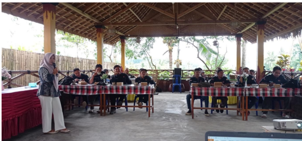
Gambar 2: penyampaian materi bimbingan teknis

Ketika pelaksanaan bimbingan teknis tersebut baik itu yang berkaitan dengan undang-undang pemilu, teknis pengawasan dan etika pengawasan, Dimana hal ini merupakan persiapan yang harus dilaksanakan sebelum berlangsungnya bimbingan teknis tentang penguatan kapasitas sumber daya pengawas kelurahan/ desa dalam rangka pengawasan rekapitulasi suara pada pemilu tahun 2024 di kecamatan Montong Gading.