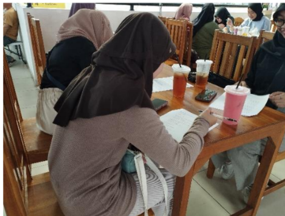
Gambar 2. Peserta Pelatihan Sedang Mengerjakan Pre dan Post Test

Narasumber sedang memberikan materi mengenai Teknik-teknik dasar dalam merajut atau Crochet secara menarik dan menyenangkan.