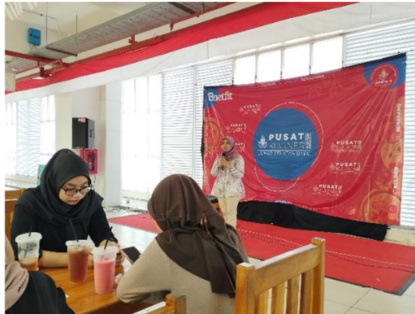
Gambar 1. Narasumber Memberikan Materi Kepada Peserta Pelatihan Crochet Sebagai Peluang Usaha

diharapkan setelah pelatihan. Secara keseluruhan, data ini menunjukkan bahwa pelatihan crochet efektif dalam meningkatkan keterampilan peserta.