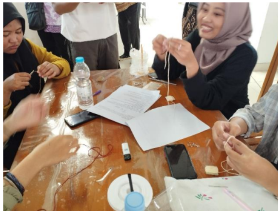
Gambar 4. Peserta Pelatihan Sedang Praktik Membuat Simpul Dasar

Narasumber sedang memberikan penjelasan dan arahan kepada peserta pelatihan secara langsung dengan perlahan-lahan dan rinci tentang bagaimana cara membuat simpul dasar untuk pemula pada Teknik Crochet atau merajut agar peserta mampu memahami dan mempraktikannya dengan benar.