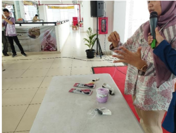
Gambar 3. Narasumber Menjelaskan dan Mempraktikan Cara Membuat Simpul Dasar Untuk Crochet

Narasumber sedang memberikan penjelasan dan arahan kepada peserta pelatihan secara langsung dengan perlahan-lahan dan rinci tentang bagaimana cara membuat simpul dasar untuk pemula pada Teknik Crochet atau merajut agar peserta mampu memahami dan mempraktikannya dengan benar.