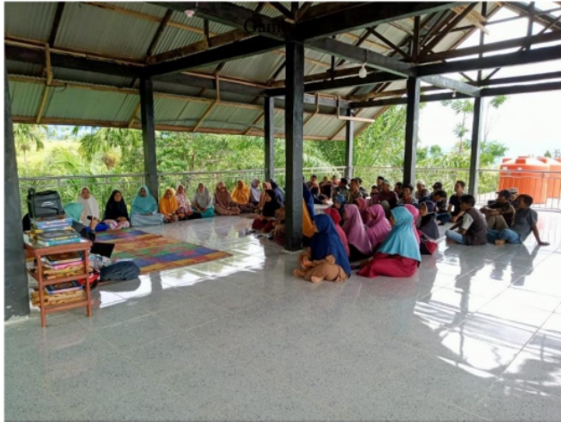
Gambar 4. Sosialisasi Ciri-Ciri Rumah Tidak Layak Huni (RTLH) Penerima Program Bantuan Stimulan Perumahan Swadaya (BSPS).