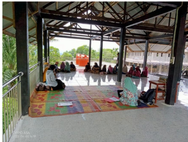
Gambar 2. Sosialisasi Kriteria Masyarakat Penerima Program Bantuan Stimulan Perumahan Swadaya (BSPS)