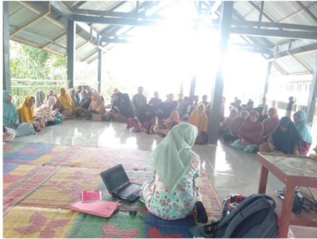
Gambar 3. Sosialisasi Syarat-Syarat Berkas Untuk Usulan Proposal Program Bantuan Stimulan Perumahan Swadaya (BSPS)