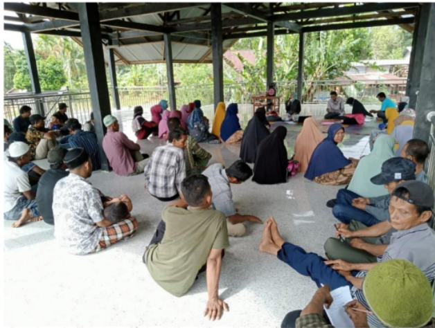
Gambar 1. Sosialisasi Program Bantuan Stimulan Perumahan Swadaya (BSPS) di Desa Negeri Antara dan Pancar Jelobok Kecamatan Pintu Rime Gayo Kabupaten Bener Meriah

Berdasarkan temuan peneliti dilapangan dalam proses pelaksanaan program BSPS kriteria penerima manfaat sudah sesuai dengan petunjuk teknis penyelenggaraan kegiatan BSPS yaitu warga negara Indonesia, memiliki tanah, berpenghasilan paling banyak sebesar Upah Minimum Daerah, belum pernah memperoleh bantuan lain dari pemerintah dan lainnya (Mamonto et al., 2022). Tujuan dari adanya program Bantuan Stimulan Perumahan Swadaya ini yaitu ingin membantu masyarakat yang belum memiliki rumah layak huni, untuk mendapatkan rumah layak huni. Untuk itu program ini memiliki sasaran dalam menjalankan fungsinya, seperti yang menjadi sasaran adalah masyarakat penerima bantuan itu sendiri, pemerintah setempat serta perangkat desa. Oleh karena itu program Bantuan Stimulan Perumahan Swadaya (BSPS) ini sudah dapat membantu dan mempercepat proses pembangunan rumah (Azmalina et al., 2023)