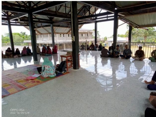
Gambar 6. Sosialisasi Keputusan Hasil Verifikasi Kepala Keluarga (KK) Penerima Program Bantuan Stimulan Perumahan Swadaya (BSPS).

Tujuan Bantuan Stimulan Perumahan Swadaya adalah untuk memberdayakan MBR (Masyarakat Berpenghasilan Rendah) agar mampu membangun atau meningkatkan kualitas rumah secara swadaya sehingga dapat menghuni rumah yang layak dalam lingkungan yang sehat dan aman. Pemerintah perlu lebih berperan dalam menyediakan dan memberikan kemudahan dan bantuan perumahan dan kawasan permukiman bagi masyarakat melalui penyelenggaraan perumahan dan kawasan permukiman yang berbasis kawasan serta keswadayaan masyarakat sehingga merupakan satu kesatuan fungsional dalam wujud tata ruang fisik, kehidupan ekonomi, dan sosial budaya yang mampu menjamin kelestarian lingkungan hidup sejalan dengan semangat demokrasi, otonomi daerah, dan keterbukaan dalam tatanan kehidupan bermasyarakat, berbangsa, dan bernegara.