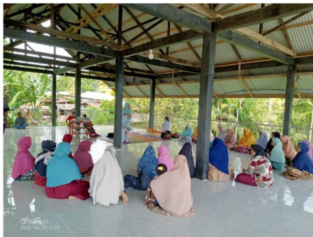
Gambar 5. Sosialisasi Subjek dan Objek Penerima Program Bantuan Stimulan Perumahan Swadaya (BSPS).