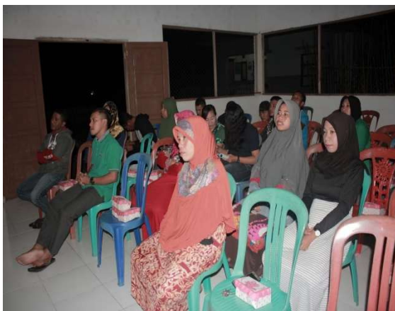
Gambar 3. Peserta