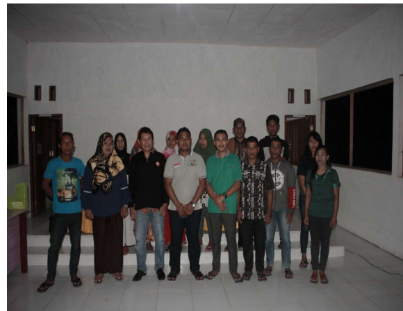
Gambar 4. Pemateri, Kades dan Peserta