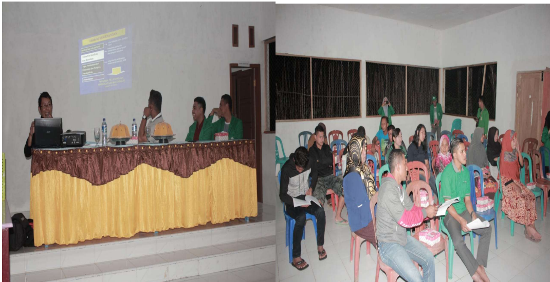
Gambar 1. Pemateri

Berikut ini dokumentasi kegiatan pengabdian masyarakat: