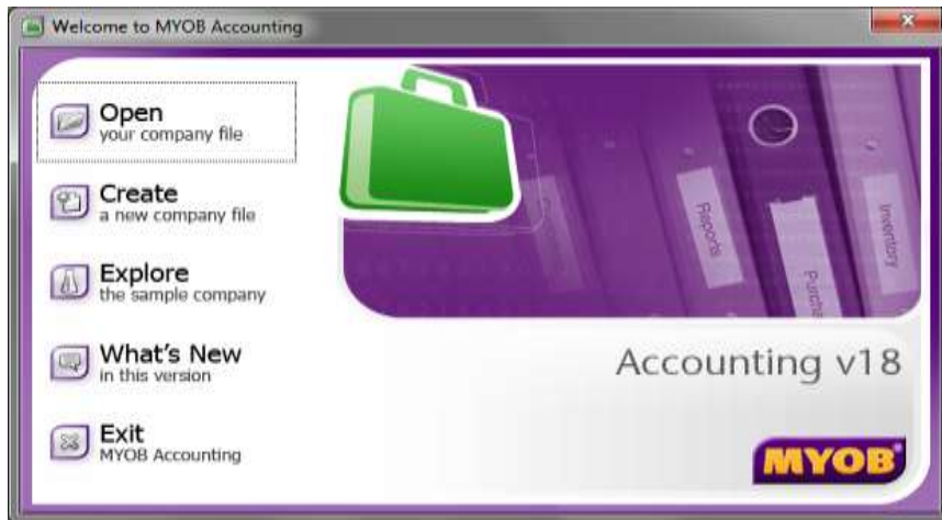
Gambar 3. Tampilan Menu Utama MYOB Akuntansi