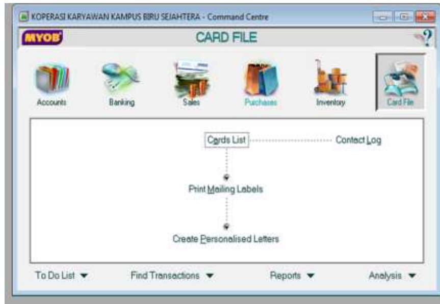
Gambar 4. Data Koperasi sudah masuk dalam Program MYOB Akuntansi

Langkah berikutnya mengganti akun-akun yang masih berbahasa inggris dengan akun-akun koperasi Karyawan Kampus Biru Sejahtera.