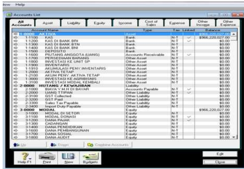
Gambar 5. Penggantian Bahasa pada akun-akun dalam Program MYOB Akuntansi

Langkah berikutnya adalah memasukkan saldo awal koperasi karyawan kampus Biru Sejahtera tahun 2022 ke dalam program, dengan cara, Klik Setup, pilih Balance, klik Account Opening Balance, lalu memasukkan neraca saldo dalam program MYOB akuntansi.