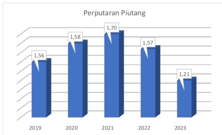
Grafik 1 Perputaran Piutang Koperasi Wanita Sedap Malam Tahun 2019 s/d 2023

Koperasi Wanita Sedap Malam dari tahun 2019 sampai dengan tahun 2023 dilihat pada tahun 2019, piutang berputar sebanyak 1,56 kali sedangkan pada tahun 2020 mengalami kenaikan sebanyak 1,58, pada tahun 2021 RTO kembali naik menjadi 1,70 kemudian dalam 2 tahun terakhir mengalami penurunan di tahun 2022 menjadi 1,57 kali, dan menurun kembali ditahun 2023 menjadi 1,21. Sehingga dapat disimpulkan bahwa perputaran piutang pada Koperasi Wanita Sedap Malam sudah berhasil karena perputaran piutangnya di atas rata-rata yang telah ditetapkan oleh Koperasi Wanita Sedap Malam. Untuk lebih jelasnya dapat dilihat pada grafik di bawah ini: